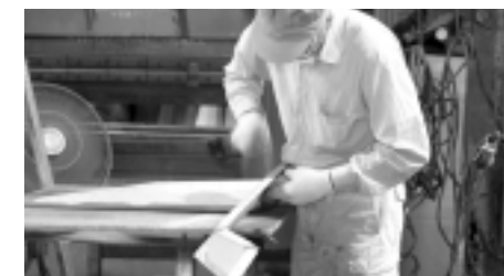
「叩いて、触って」を何度も繰り返し、部品を造り上げる

ピヤ樽、ハムなどを車両にかたどったものや、きれいなイラストのついたものなど、さまざまでした。そのどれもが、当時の従業員がすべて手作業で造り上げたものです。これらの車両は、産業界の発展に寄与していると思っています。