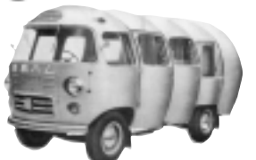
ピヤ樽型(上)とハム型(下) (どちらもRK型普通四輪宣伝車)