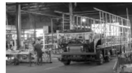
製作中の馬匹車。ヘアシャシー上に鉄骨でキャブ部分を含め新設

7度というトップクラスの荷台傾斜角を実現。更に道板からローアングルスロープにより、ロードクリアランスの小さな車両の積載・運搬が安全・スムーズに行える