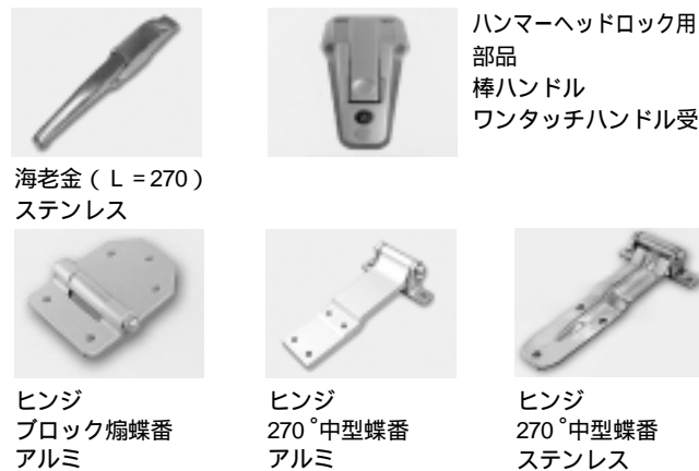
海老金 (L=270) ステンレス

自動車車体製造用部品は、ヒンジ類、ランプ類、フェンダー、材料加工品、化成品類、鋳物、鍛造品類、接着剤など幅広く取り扱っており、お客様からも好評を得ている。