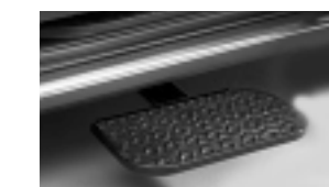
マツダMPV用 電動補助ステップ