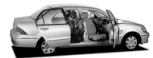
電動スライド式リアドア 車椅子用ローダ