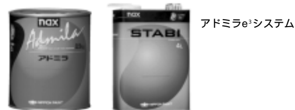
アドミラe 3 システム

この3つの新塗装システムは「EASY」「EXCITING」「ECOLOGY」という3つのコンセプトからなる「e 3 (イーキューブ)」シリーズとして展開している。