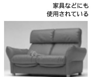
家具などにも 使用されている

お問い合わせ先 アキレス㈱ 本社 〒160-8885 東京都新宿区大京町22 TEL : 03-3225-2170（代表） FAX : 03-3225-4013 URL : http://www.achilles.jp