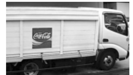
スクリーン印刷 （コココーラ配達車）

お問い合わせ先 ㈱星光商会 本社 〒107-0052 東京都港区赤坂3丁目9-16 TEL : 03-3585-2300（代表） FAX : 03(3587) 0246 URL : http://www.seikoshokai.co.jp