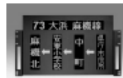
LED式側面行先表示器 KS-L7111C形