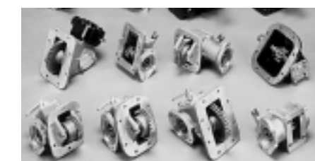
パワーテイクオフ （P.T.O.）

その他にも、ポンプ・ウインチ・増減速機・旋回減速機等組立品及び部品の設計製造、旋盤・ホブ盤・マシニングセンタ等による歯車・ケーシング等の加工など、特装トラックメーカーから高いニーズがある。