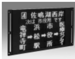
バス用側面LED 行先フルドットタイプ KS-L7360形

他にもLED運賃表示器、駅ホーム用LED式案内表示システム、電車・バス用LED行先表示器、電車用故障モニタシステム、電車用運転台パネルシステム等があり、ハイテク技術を駆使し、開発、製造している。