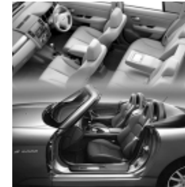
「カブロン」を使用した 各種自動車車両用座席シート

中でも、車両内装用合成皮革は、各種車種に採用され、最も品質物性要求の厳しい座席メインサイド部にも使われている。やわらかな風合いと軽さで定評のある「カブロン」は、車両の他にも靴・鞆、家具用等をはじめとして、さまざまな用途でその長が活かされている。