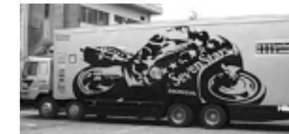
カットティング （ホンダ・トランスポーター）

その他にも、自動車部品をはじめ看板・サイン・道路標識等、高い耐候性を要求される物が多く、常に最高の品質を提供できるように技術体制を整えている。