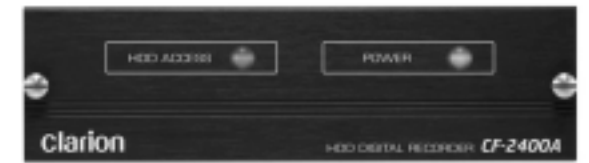
業務車専用ドライブレコーダー CF-2400

お問い合わせ先 クラリオン㈱お客様相談室 TEL : 0120-112-140 （土・日・祝祭日を除く / AM 9 : 00 ~ 12 : 00 PM 1 : 00 ~ 5 : 30） PHS、携帯電話からもご利用頂けます。 FAX : 048-601-3807 URL : http://www.clarion.com/jp