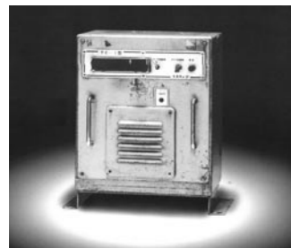
日本初の路線バステープ放送装置「TC-1型」

㈱レゾナント・システムズ(旧・ネプチューン)はネプチューンラジオとして昭和27年に創業。以来、業界のニーズの先駆けを創り出している。