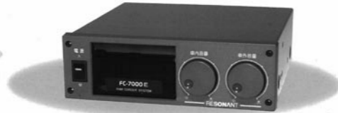
現在発売中のFC-7000E。放送だけでなくECOドライブ、安全運転のサポートなど多目的な用途に対応している

系統・停留所データが利用できたり、安全運転、エコ運転の指導、車両の燃費管理まで行える。1台の機械で3役、4役以上の役割をこなしている。