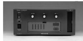
オール音声合成を実現したラムコーダー「TLS-1」

1962年、日本初となる路線バス用放送機「TC-1型」が発売された。それまでのバスは車掌が行き先、停留所案内を行っていたが、テープ放送で行き先を案内するという斬新なアイデアで、路線バスのワンマン化の実現に大きく寄与した。また整理券を発行し、料金を支払うという現在のバス乗降システム「中乗り、前降り」もこの頃の同社による発案だという。