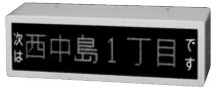
日本初のLED式停留所名表示器