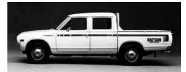
国内初の「アクセントストライブ」を製作

国内で初めて企業のロゴやマークをスコッチライトフィルムを切り抜き自動車に貼り付ける「マーキング」で「車時代」の幕明けと「宣伝時代」に寄与した