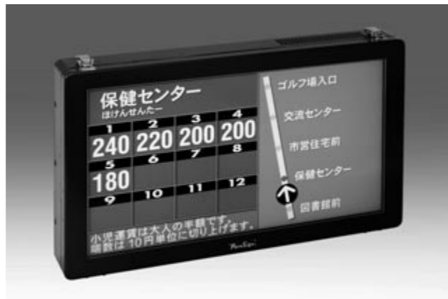
高性能LCDパネルを採用、高輝度、広視野角を実現。 表示画面の編集は市販のパソコン上で簡単に作成できる。