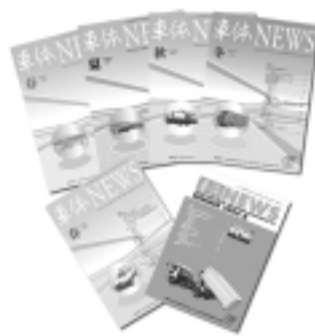
年4回発行される車体NEWS。3カ月に1回開かれる広報委員会で内容が検討され、発行となる

対外広報活動の一環として、当会の紹介パンフレットを見やすく、わかりやすく刷新する計画もこの広報委員会で進めており、12月に完成予定である。