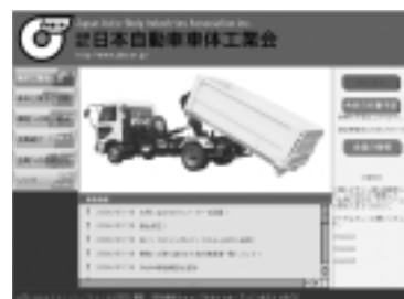
10月に公開を予定している車体工業会HP。見やすくわかりやすくを念頭において刷新した。トップページに掲載される写真は車体NEWSとタイアップしていく予定