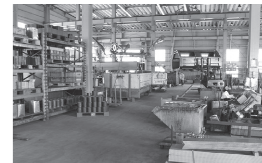
「きれいな職場は仕事が進む」整然とした工場内