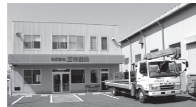
工場横の事務所と納品用トラック

各工程ごとに熟練技師たちが経験を活かし製造に励み、各工程ごとに検品を経て、次工程へと移行しています。最終検品の後、工場にてユーザー様にお引渡しし、大型クレーン付車にてお届けしています。