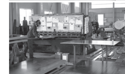
幅広い年齢層のスタッフが働いている