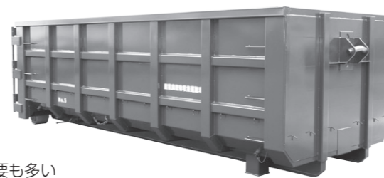
大型のコンテナも手がけている