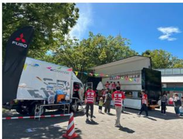
三菱ふそうトラック・バス（株）南関東ふそう