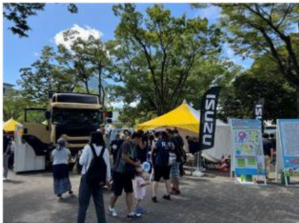
いすゞ自動車首都圏（株）

また、その他メーカー・企業のブースでは、シートベルト衝突体験や、衝突事故車両の展示・交通安全グッズの販売など、交通安全について体験・学べるブースもあり、大人から子供まで大変好評を頂きました。