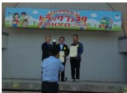
グリーン・エコプロジェクトトップランナー優秀賞表彰