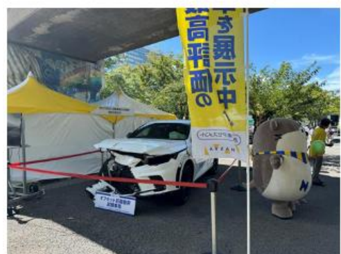
(独) 自動車事故対策機構東京主管支所