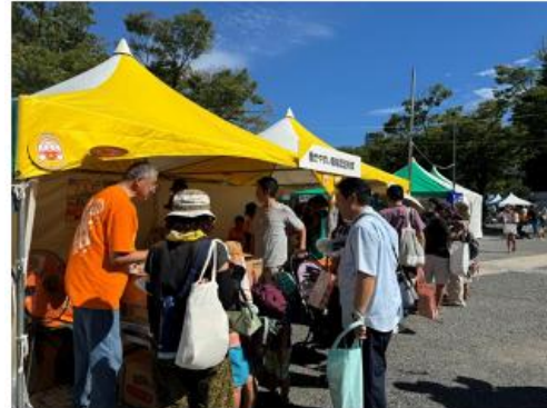
働きやすい職場認証制度