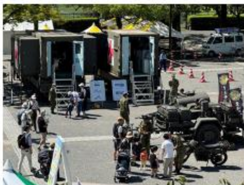
自衛隊東京地方協力本部