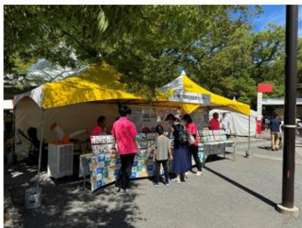
（一財）関東陸運振興センター