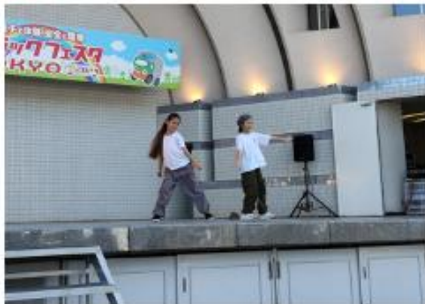
トラックダンス動画コンテスト表彰