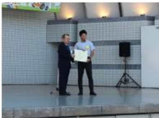
トラックドライバー・コンテスト最優秀者賞

トラックドライバー・コンテスト、グリーン・エコプロジェクトトップランナー優秀賞等の表彰式や、交通安全を学べるミュージカル、楽器の演奏、地域の大学によるパフォーマンスなど様々なステージプログラムをご用意し、多くの来場者の方に楽しんでいただきました。