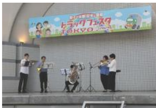
金管6重奏でこぼこプラス