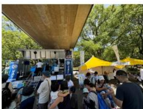
(一社) 日本自動車連盟東京支部