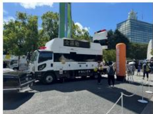
警視庁高速道路交通警察隊