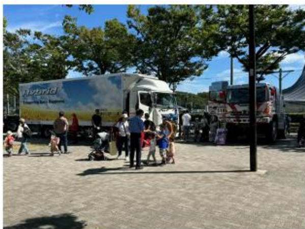
南関東日野自動車（株）