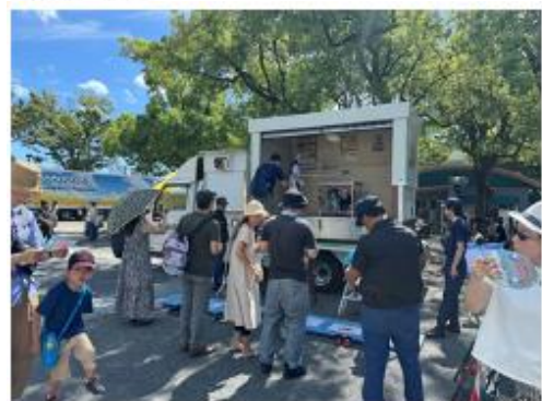
消防庁渋谷消防署