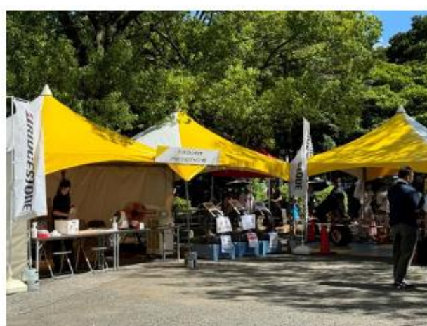
ブリヂストンタイヤソリューションジャパン（株）