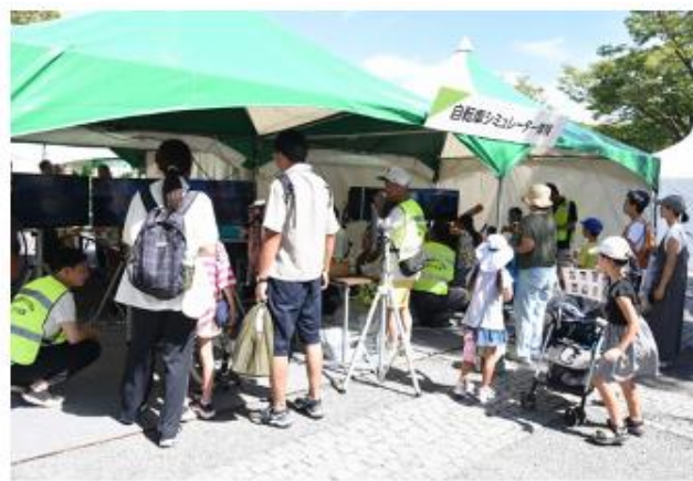
深川・城東・江戸川支部