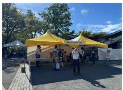
東京都生活文化スポーツ局