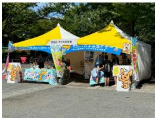
警視庁代々木警察署