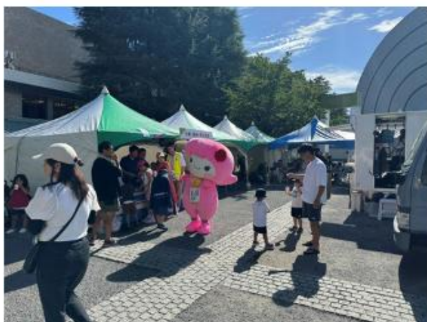
台東・墨田・荒川支部