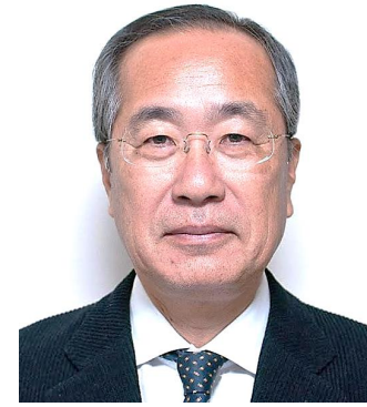
自動車精工株 宮幸 朗