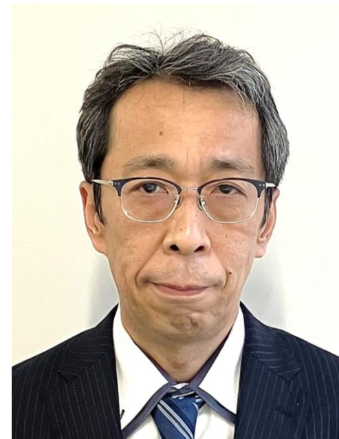
三菱ふそうバス製造(株)